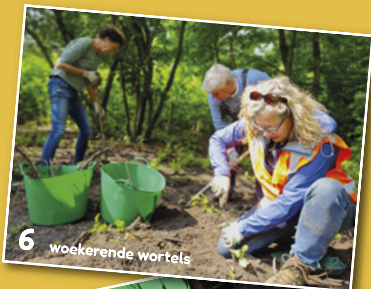
6 woekerende wortels